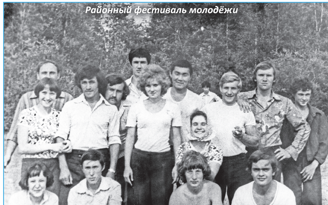
Районный фестиваль молодёжи

В 1978 году ленинский комсомол отмечал своё 60-летие, а Таловский завод ЖБК - 20-летие официального ввода в эксплуатацию. Празднование этих круглых юбилейных дат было ознаменовано прибытием в Таловку агитпоезда «Комсомольской правды» с известными артистами советской эстрады. Па-